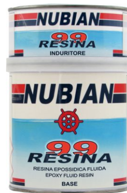
Latta da 750 ml.