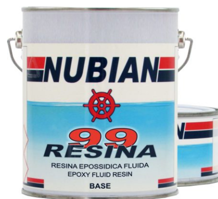
Latta da 2,5 Lt.