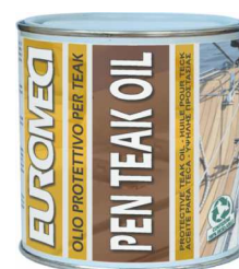
Latta da 750 ml.

Peso specifico / specific gravity / densité: 0,9 kg/l (+/- 0,1)