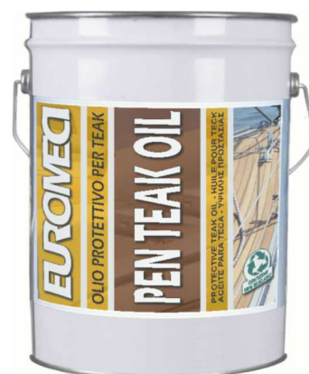
Latta da 20 Lt.