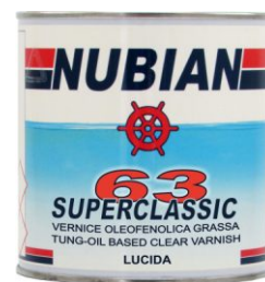
Latta da 750 ml.