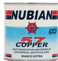
Latta da 750 ml.

CONFORME CONFORME BPR BPR PROFESSIONALE DO IT YOURSELF