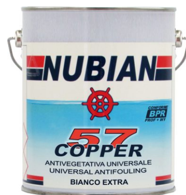
Latta da 2,5 Lt.