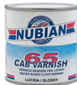
Latta da 750 ml.