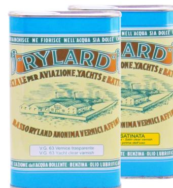
Latta da 1 Lt.