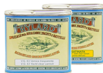
Latta da 500 ml.