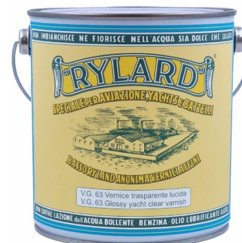
Latta da 2,5 Lt.