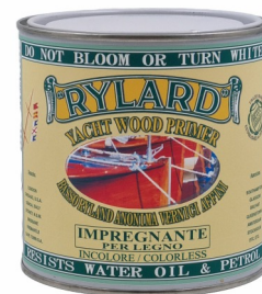
Latta da 750 ml.