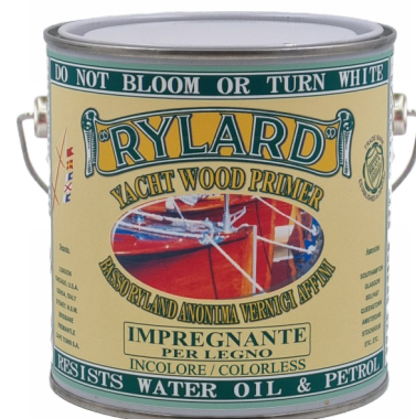
Latta da 4 Lt.