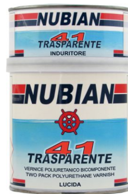
Latta da 750 ml.