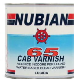
Latta da 750 ml.