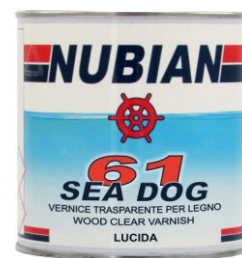
Latta da 750 ml.