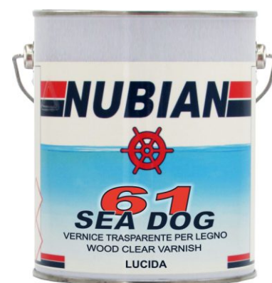
Latta da 2,5 Lt.