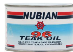
Latta da 375 ml.