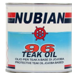
Latta da 750 ml.