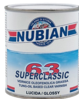
Latta da 750 ml.