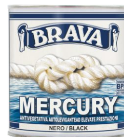
Latta da 750 ml.

CONFORME CONFORME BPR BPR PROFESSIONALE DO IT YOURSELF