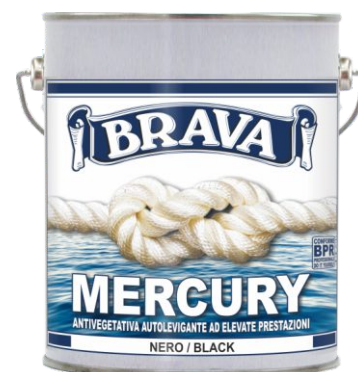
Latta da 2,5 Lt.